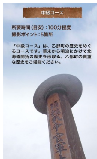
▲ 歴史をめぐる中級コース