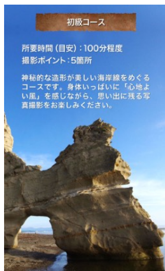
▲ 海岸線を巡る初級コース

オトベンチャーには、楽しみながら魅力を発掘する、初級、中級、上級の3つのコースが用意されています。また、コースの途中で立ち寄れるお店情報や、最新の情報が閲覧できる公式Facebookページ、YouTubeチャンネルへのリンクも用意されています。