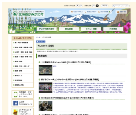
▲ タイトル、コメント、動画を自動表示