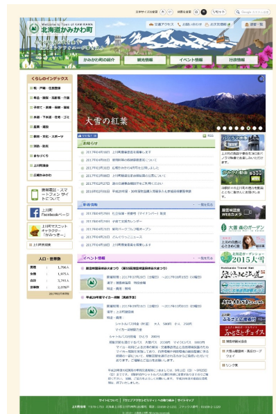
▲ 役場のトップページ

上川町は、北海道のほぼ中央に広がる日本最大の山岳自然公園「大雪山国立公園」の北部に位置し、今もなお原始の面影を残す大雪山連峰の自然を背景に、北海道第一の河川、石狩川の清流にも恵まれた自然に包まれた町です。大雪山系一つ黒岳への登山口には、北海道有数の温泉街である層雲峡温泉があり、大雪高原温泉の秋の紅葉は「日本一の紅葉」として知られています。またスキージャンプのオリンピック選手の出身地としても有名です。