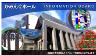
▲ かみんぐホールの電子掲示板