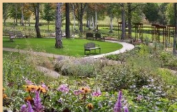
上川町 様 約700品種の草花が植栽された「大雪山のガーデン」