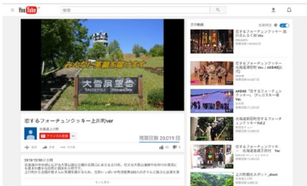
▲ YouTubeチャンネルに動画を登録

観光映像など、町のYouTubeチャンネルに動画を登録いただくだけで、タイトル、コメント、動画を自動的にサイト内に掲載することができます。CMS内での登録作業を必要としませんので、担当職員の方の作業も軽減できます。