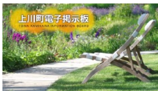
▲ 上川町役場内の電子掲示板

今回のリニューアルでは、組織全体でホームページを更新する体制作りも一つの課題でした。使いやすいCMSを導入することにより、各部署から更新作業がスムーズに行えるようになりました。また、導入の翌年には、役場と町内の施設「かみんぐホール」に設置されたデジタルサイネージのコンテンツも同一のCMSで管理しています。入力作業は同じ操作で行えますので、職員の作業軽減につながりました。