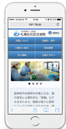
▲ スマートフォン版

忙しい病院業務の中でも、担当者が迅速な更新作業が可能になるよう、入力の手軽さを目標に、CMS「WebRelease」でサイト構築を行いました。