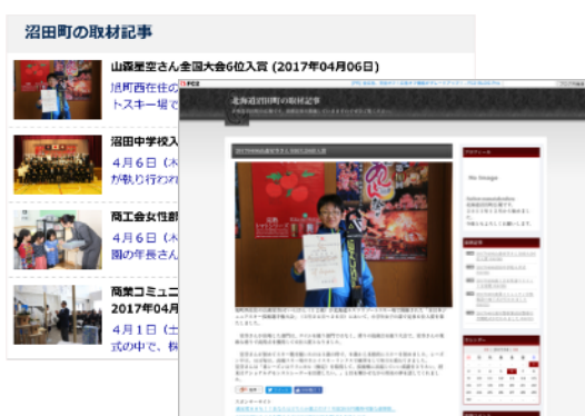
▲ 既存のデータをコンテンツ資産として活用