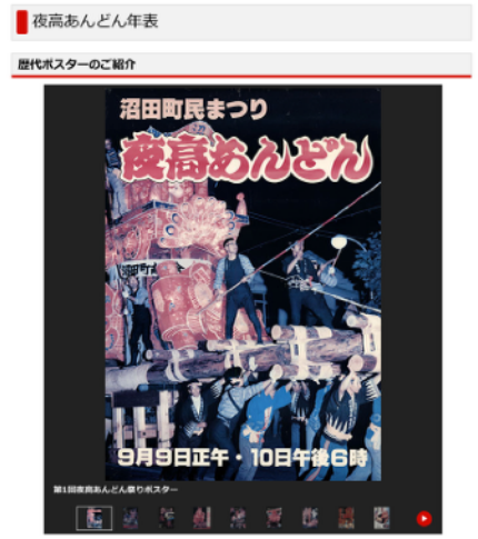
▲ 第1回からのポスターも掲載