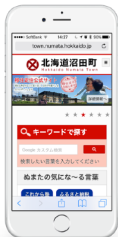
▲ スマートフォン版

これまでの情報を整理し、町の取り組みを前面に押し出したホームページを、「WebRelease」で管理しています。