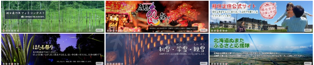
▲ 取り組みを紹介する写真スライド

沼田町は、雪と共存しながら生活をしていく取り組みをはじめ、独自のイベントや移住定住など、町外に対して積極的なアピールを行っています。現在力を入れている内容をトップページのスライドショーとして紹介しています。