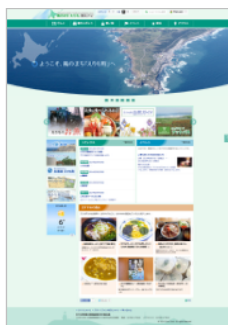
▲ 風の街「えりも」観光ナビ