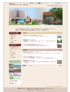
▲ 郷土資料館「ほろいずみ」