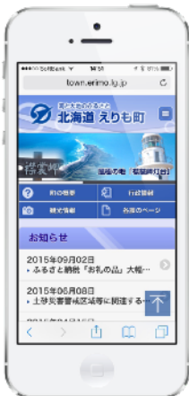
▲ スマートフォン版

今回のリニューアルでは、これまでのサイトに掲載されていた情報だけではなく、まち全体の様々な情報を見直し、整理することにより、『えりも町役場』の他、観光情報を集約した、『風のまち「えりも」観光ナビ』、襟裳岬にある観光施設『風の館』、『郷土資料館ほろいずみ・水産の館』の4サイトを同時にオープンすることができました。既存サイトを一新し、観光情報に特化した新規サイトをオープン、一度の入力でスマートフォン最適化ページができたことなど、CMS「WebRelease」を活用し、これまで以上に迅速な情報発信が可能となりました。