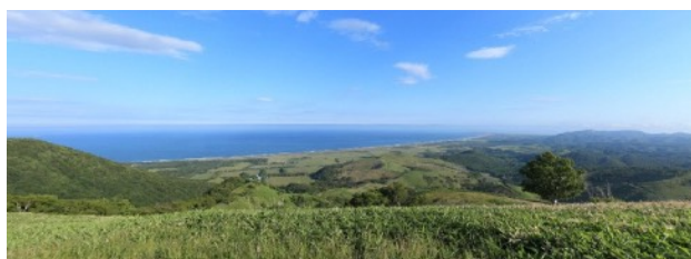
▲ 旧北海道肉牛牧場（大展望）からの景色